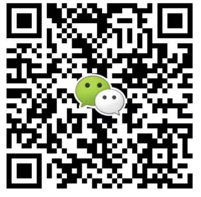
● 华北华东地区及海外咨询 滕老师