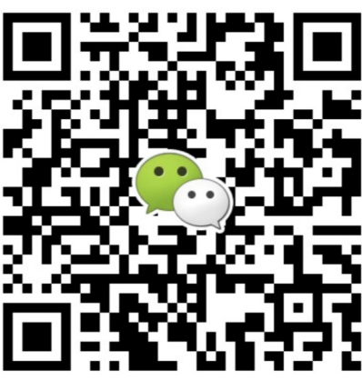
● 华南地区及海外咨询 叶老师